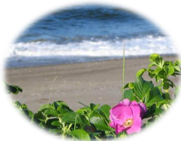
弓ヶ浜 はまなすの花

利用者の希望に応じて、「通い」「訪問」「泊まり」 および多様なニーズに対応する 機能を組み合わせてサービスを 提供することで、 住み慣れた地域での生活が 継続できるよう支援します。