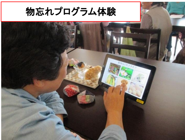
物忘れプログラム体験