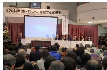
第11回弓浜助け合いネットワーク の様子