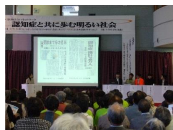
第10回弓浜助け合いネットワークの様子