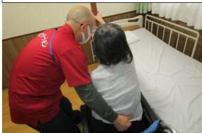
リハビリ職員からの日常生活動作の評価・機能訓練指導