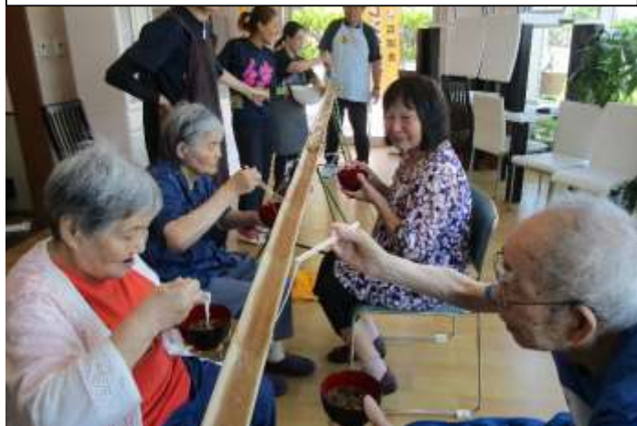
調理レク(流しそうめん)