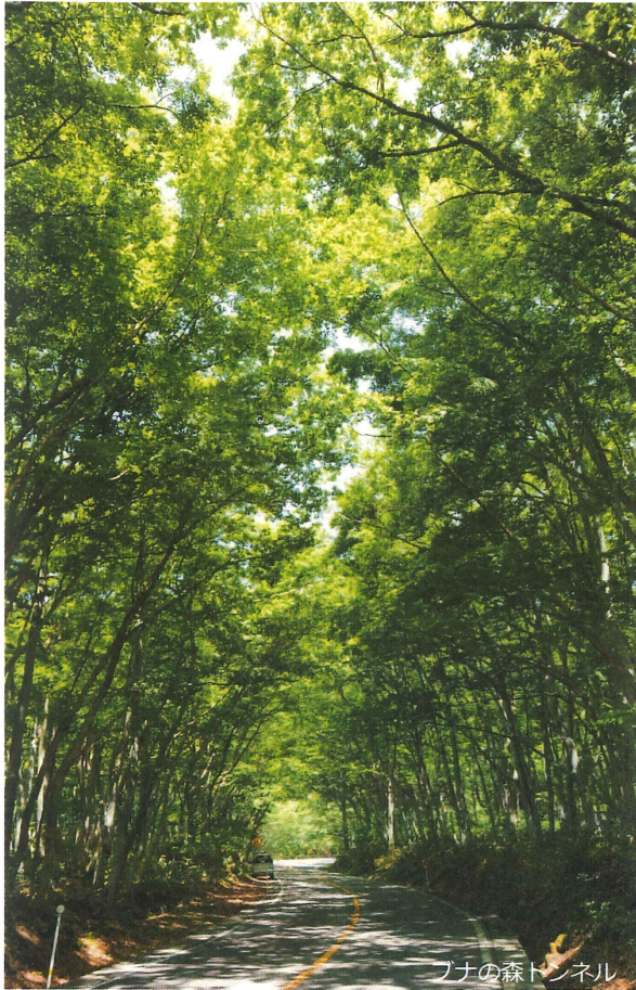
ブナの森トンネル