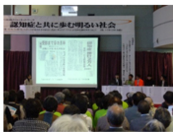
第10回弓浜助け合いネットワークの様子